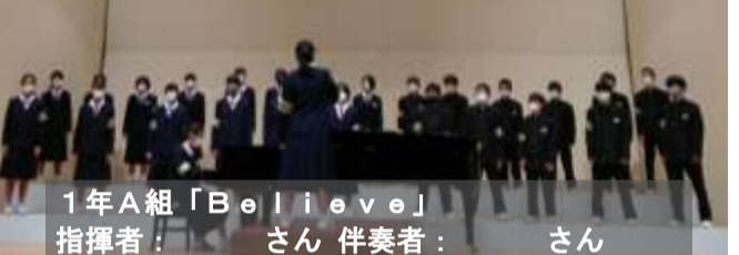
1年A組「Believe」 指揮者：さん 伴奏者：さん