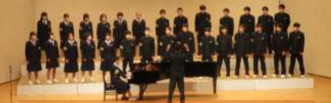
3年A組「友～旅立ちの時～」 指揮者：さん 伴奏者：さん

この曲と同じ想いや悩みを抱える私たちの気持ちをどう表現すればよいか、思いを込めて歌います。