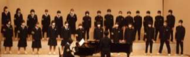
2年B組「旅立ちの日に」 指揮者：さん 伴奏者：さん