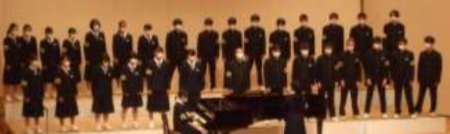
2年C組「My Own Road」 指揮者：さん 伴奏者：さん