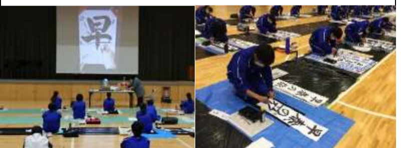
講師は 先生(左写真)

年の瀬が近づくと、国語の授業では、毎年、「書き初め教室」を実施します。今年は、地域の書道専門の先生のお力をお借りすることと、ICT機器を活用することにより、さらなるレベルアップを図りました。