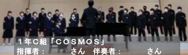
1年C組「COSMOS」 指揮者：さん 伴奏者：さん

「時の流れに呼ばれたものなら一人残らず幸せになれるはず」、今日は最高の「COSMOS」をお届けします。