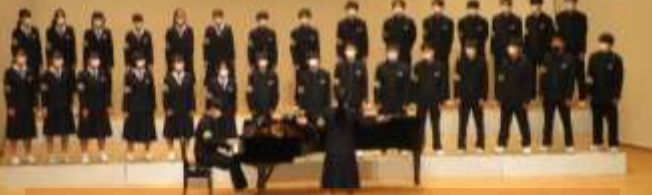
3年B組「ふるさと」 指揮者：さん 伴奏者：さん