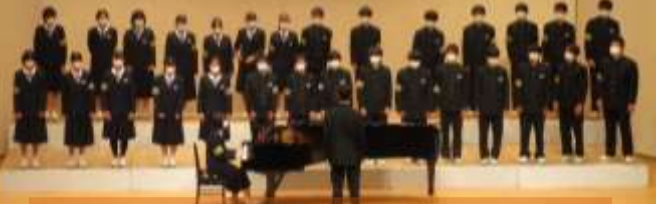
3年C組「手紙～拝啓十五の君へ～」 指揮者：さん 伴奏者：さん

この曲と同じ想いや悩みを抱える私たちの気持ちをどう表現すればよいか、思いを込めて歌います。