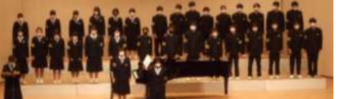
2年A組「空は今」 指揮者：さん 伴奏者：さん

練習期間の短さを考慮しコンクール形式をとらないとしたことで、生徒のモチベーションは上がるのかという心配がありました。しかし、本来、合唱は競争するために行うものではありません。「みんなで合唱することの本当の意味」について、一人ひとりが真剣に考え、その答えに辿り着くことができるか、それが問われる「コーラスフェスティバル」となりました。